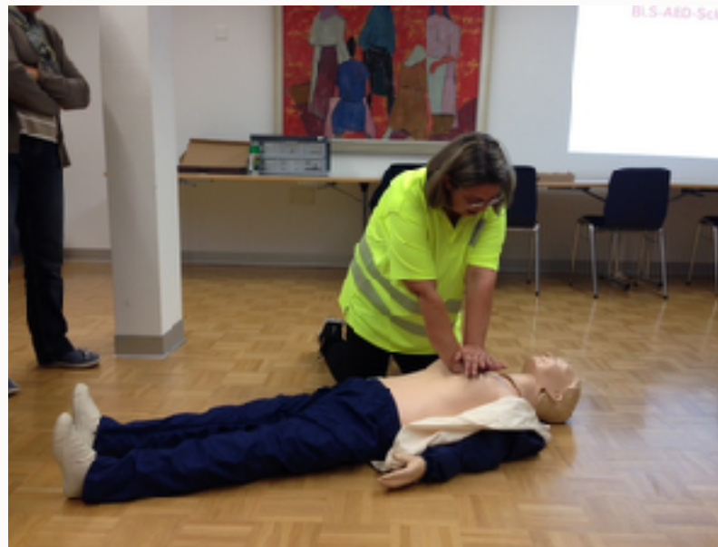
Die Kompression sollte jeweils 1/3 von der Körperhöhe gedrückt werden. Fortlaufend! Auch

während Aufbau vom AED. AED ist der Defibrillator. Beispiele für Hinweisschilder: